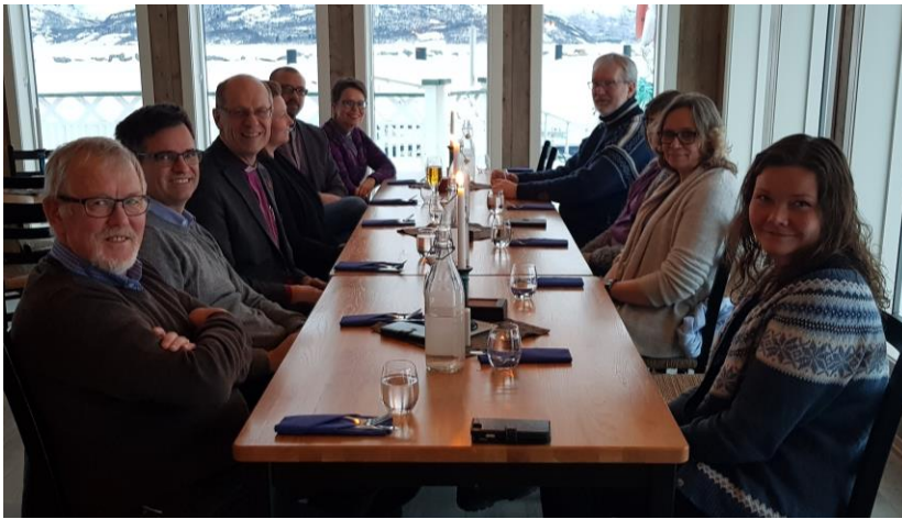
Møte med ansatte i både Lavangen og Salangen