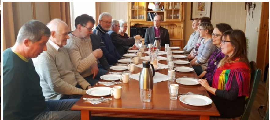
Møte med menighetsrådet