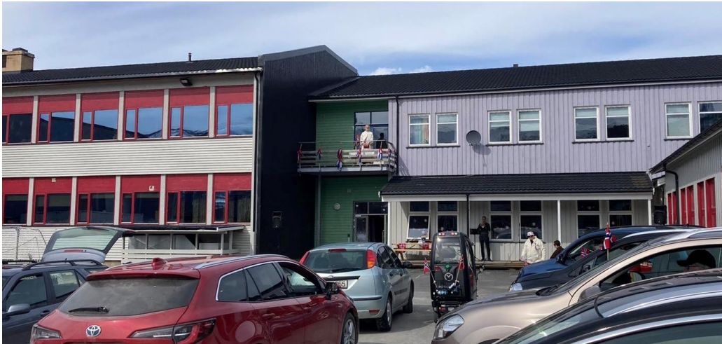
Bilde fra drive in gudstjeneste på skolen 17.mai 2020

I 2019 ble det holdt gudstjeneste ca annenhver eller tredje søndag. Som i tidligere år ble det holdt en samisk/norsk gudstjeneste på Spansdalen grendehus, og seks på Lavangsheimen. Det var 5 flere gudstjenester enn i 2018, hvor 2 av disse var på Lavangsheimen. Lavangens forordning er fortsatt ikke ajour. Under bispevisitasen i mars ble det avholdt en felles gudstjeneste med Salangen. Dåpsgudstjenestene er fortsatt de gudstjenestene med klart flest fremmøtte. Tallet på de som går i kirken på julaften går ned, mens påskens gudstjenester hadde økt fremmøtte. I 2019 var det to messefall; på Kristi himmelfartsdag var det ingen fremmøtte, og det andre messefallet i november var pga. sykdom. Tallet på nattverdsgjester er mer enn fordoblet etter at det er avholdt flere gudstjenester med nattverd.