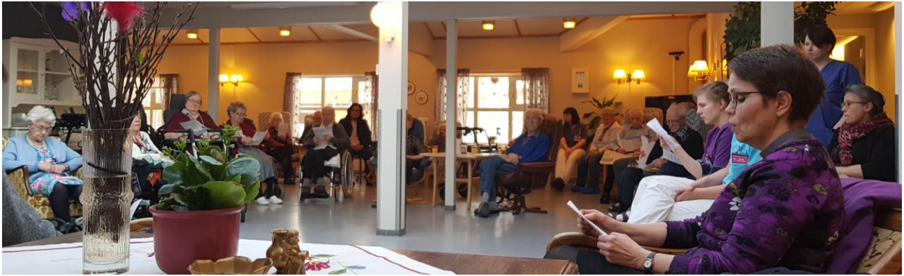
Andakt på Lavangsheimen