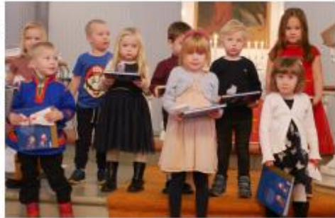
Hvilken er finest?

4-årsbok ble utdelt i gudstjeneste den 15. november. Det var 9 barn som mottok boken. Menighetsbladet ved Andreas Bay gjorde intervju med barna og tok bilder. Fin reportasje i Over Eie.