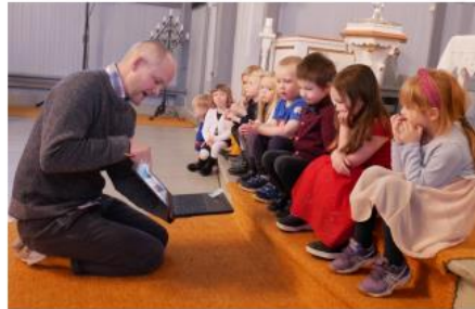
Dyp konsentrasjon rundt gjennomgangen av forskjellige krybbe-varianter.

Påskevandring, tårnagent, barneleirene, pinsefest, utdeling av bibel til 11 åringene ble avlyst pga Corona. Lys-våken ble utsatt. Planlagt å utsette lys våken til våren dersom smittebildet endrer seg positivt.