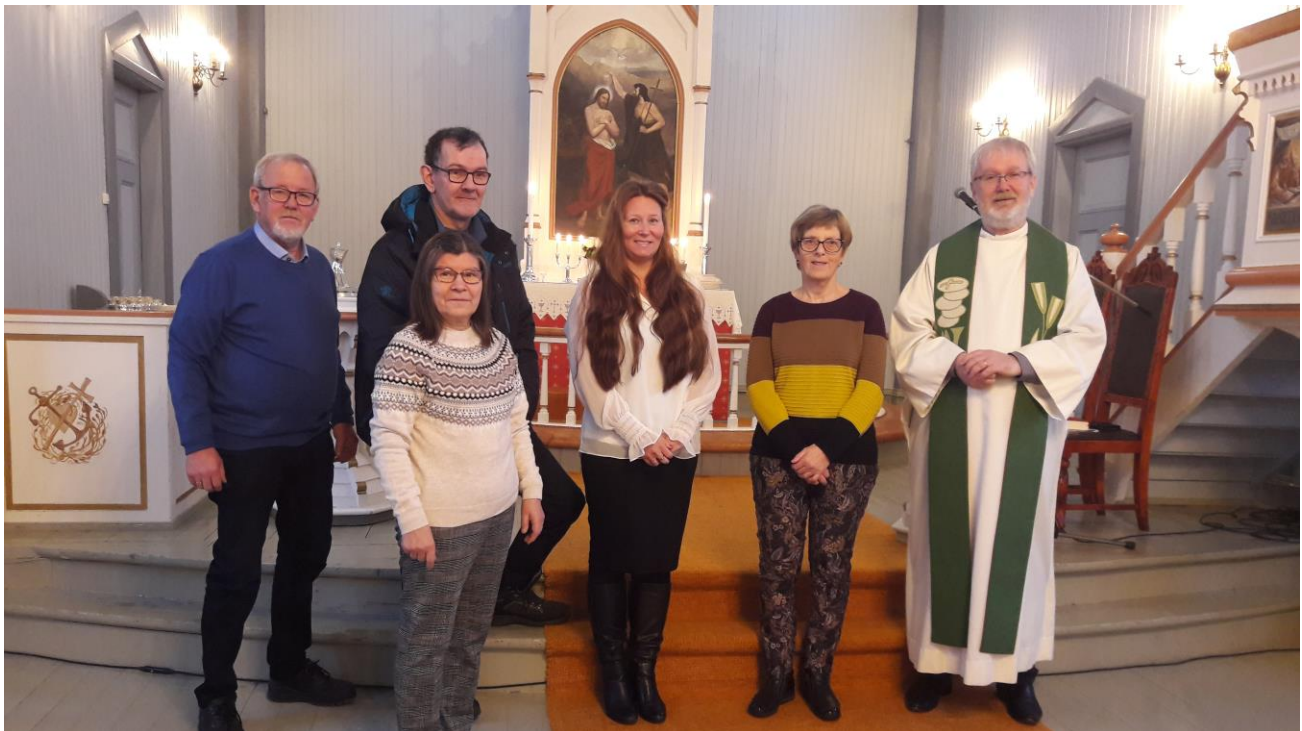
Det nye menighetsrådet blir presentert for menigheten på gudstjenesten

Det var 5 møter i 2020, og rådet behandlet 48 saker. Av viktige saker kan nevnes: Ansettelse menighetsarbeider, misjonsavtale, budsjett og regnskap, smittevernplan, gudstjenestereform av 2019, prestesituasjonen i Lavangen, menighetsblad, kirkekaffe, kjøkkenkrok i kirka.