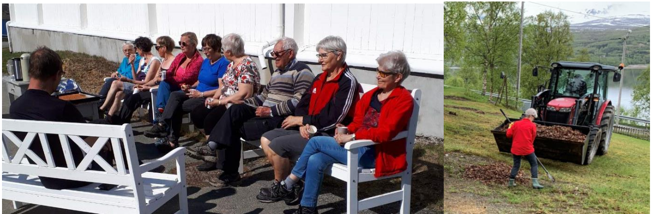
Formiddagsgjengen under dugnaden i 2019.

Det ble utført vår dugnad på kirkegården en dag på forsommeren både i 2019 og i 2020. Takk til frivillige som trofast støtter opp om dugnadene.